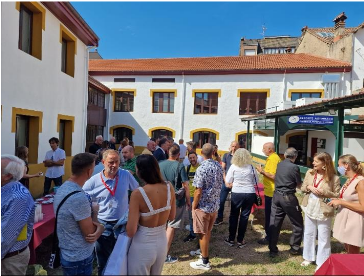
Durante el networking