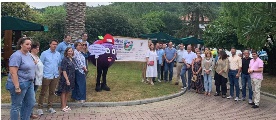
Mercado Parque Vallina